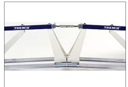
Knick +/- 5%