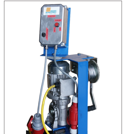
Drehzahlregulierung zu Winde