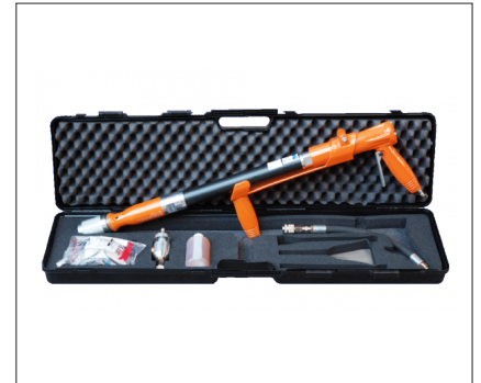
Standartzubehör im Set (im Koffer)