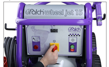
Éléments de commande simples