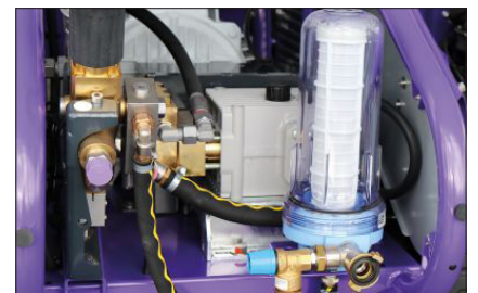
Grand filtre à eau