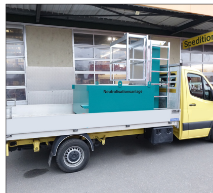
Einfacher Transport mit Lieferwagen