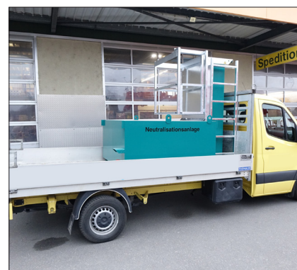
Transport par camionnette