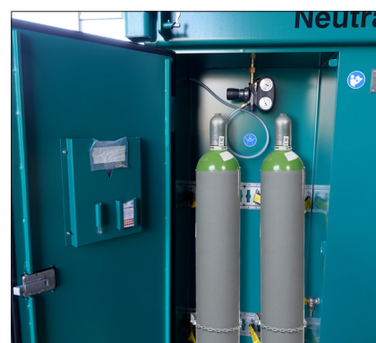
Armoire intégrée pour la bouteille de CO 2