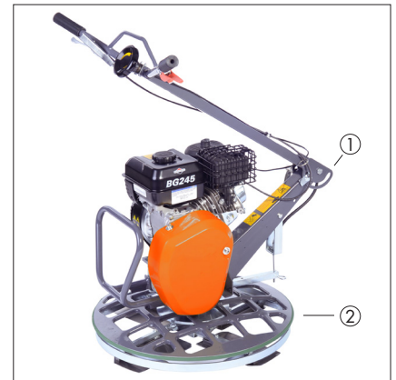
① Klappbare Deichsel ② Abrollring