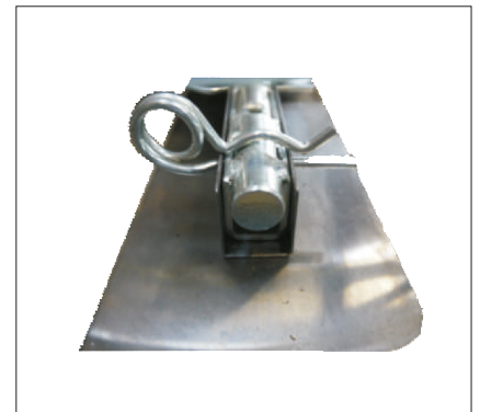
Stecksystem für schnelles wechseln der Flügel