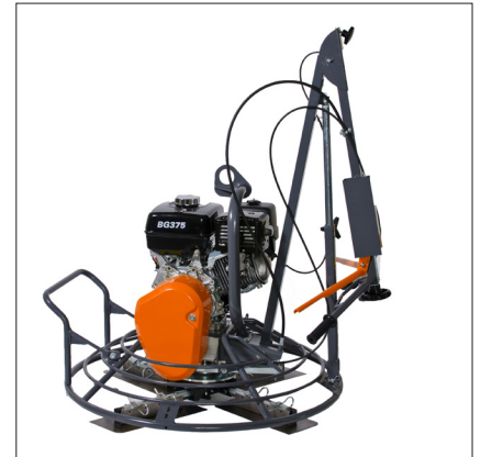
Klappbare und einstellbare Deichsel