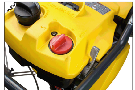
Motor und Kraftstoffzufuhr mit kombinierten Schalter