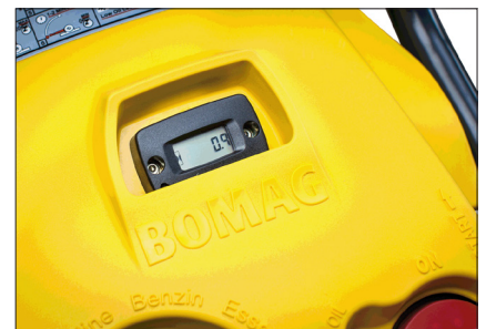
Stundenzähler/Drehzahlmesser mit resetbarer Serviceanzeige