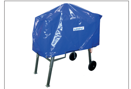
Optional mit Abdeckhaube