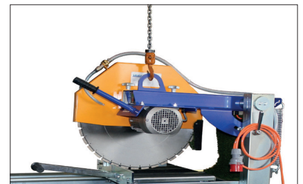
Kranöse für einfachen Transport