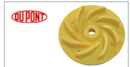
Pumpenrad aus verschleißfestem Polyurethan